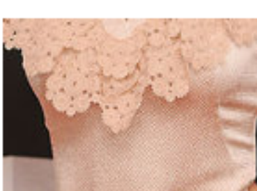
La actriz que rechazó ser preciosa