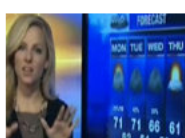
Sorpresa en directo de la chica del tiem...