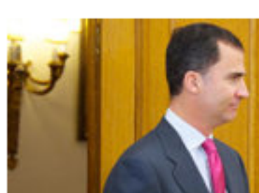
¿Dónde compra el Príncipe sus regalos?