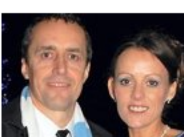
El vestido de novia más escandaloso